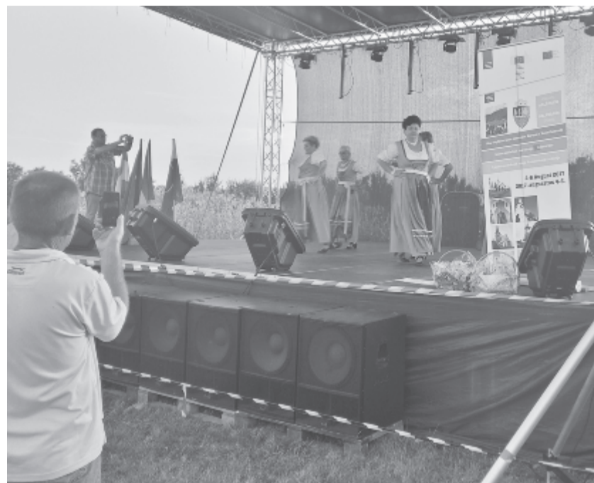
Kulináris és kisebbségi értékeiket is megmutatták a vendégek

Ezzel párhuzamosan a hét végén községnapok zajlottak Balavásáron,