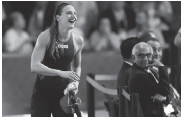
A magyarok háromszoros olimpiai bajnoka megdöntötte önmaga 2015-ös világrekordját

* Hosszú Katinka 56,51 másodperces világcúccsal nyert 100 méter vegyesen az úszók Berlinben zajló rövidpályás világbajnokságának hétfői napján. A háromszoros olimpiai bajnok magyar klasszis önmaga 2015 decemberében felállított 56,67 másodperces idejét döntötte meg. A hétszeres nagyedencés világbajnok magyar sztár a világcúcsért 10 ezer dolláros bónuszt kap.